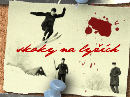
skoky na lyžích