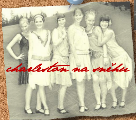
charleston na sněhu